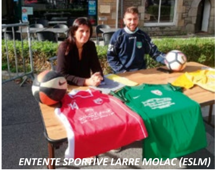
ENTENTE SPORTIVE LARRE MOLAC (ESLM)