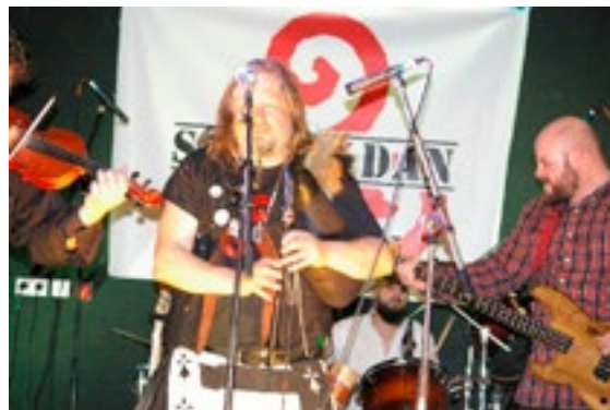
SON AR DAN

Le groupe Nantais a ouvert la soirée. Son répertoire, festif et dynamique, est constitué de compositions avec un chant en anglais, en breton ou en français, de chansons traditionnelles (Irlande, Bretagne, Ecosse) remaniées, boostées et de quelques reprises de hits de la scène punk celtique, punk-folk.