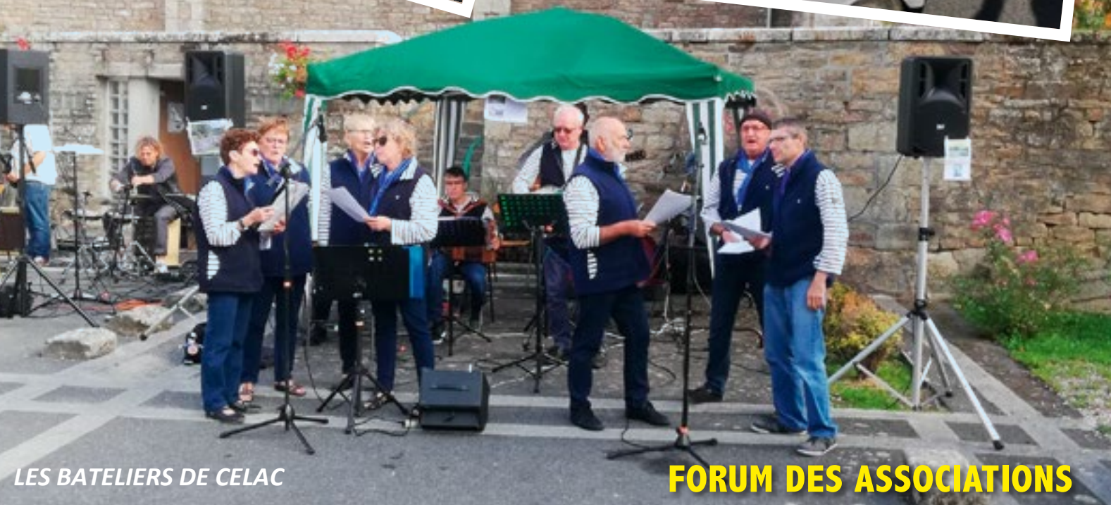
LES BATELIERS DE CELAC