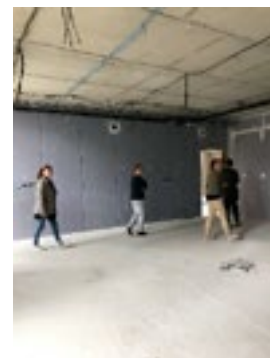
Une salle de classe

L'école a fermé ses portes avec des projets pleins les cartables pour une rentrée que nous espérons plus clémente. Ainsi les CM1/CM2 vivront une année sous le signe du mystère et de la magie avec une classe spéciale Harry Potter.