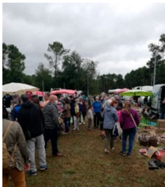
Vide grenier du 30 août 2020

CONTACT : 02.97.45.72.90 / 06.83.42.83.91 molacexpo@orange.fr Web : molacexpo.com