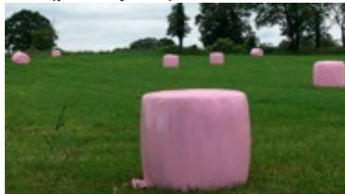
Enrubannage d'herbe rose, pour financer la recherche contre le cancer du sein.

nouvelles couleurs d'enrubannage : l'agriculteur verse un don à l'Arc pour la lutte contre le cancer du sein (pour le rose), le cancer de la prostate (pour le bleu) et les cancers des enfants (pour le jaune).