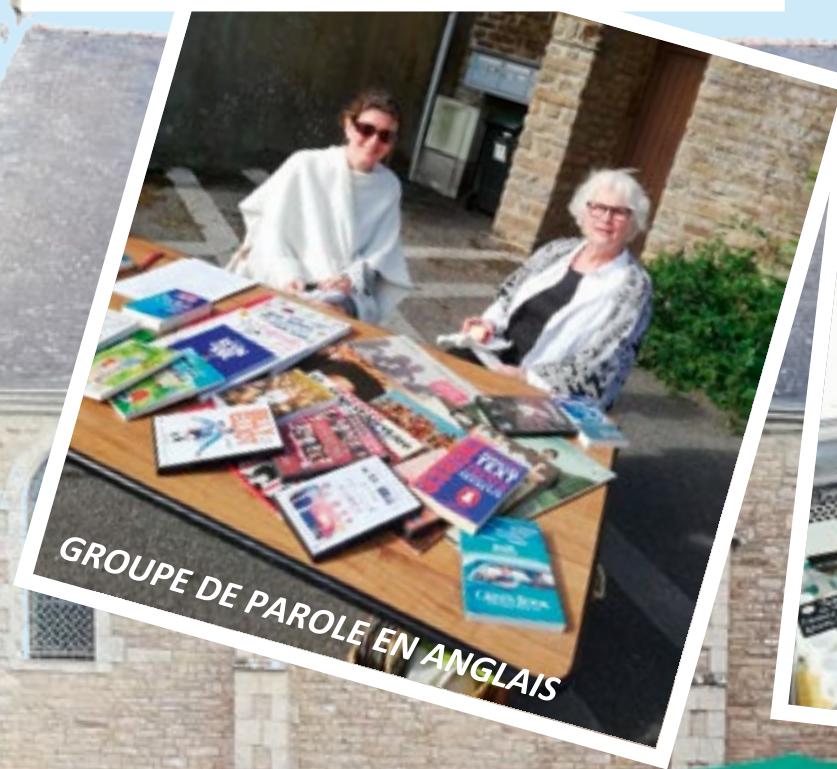
GRUPE DE PAROLE EN ANGLAIS