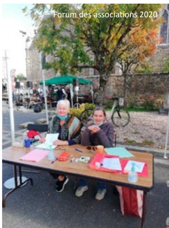
Forum des associations 2020