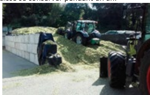
Confection du silo de maïs lors du chantier d'ensilage, en octobre.

Le maïs a été semé entre fin avril et mi-mai, après que l'agriculteur ait préparé la terre. Pour faire de l'ensilage, le maïs est récolté fin septembre début octobre avec une ensileuse qui hache les plants de maïs en morceaux de 1 à 2 centimètres. A la ferme, le maïs ensilage est stocké en tas très tassé de telle manière qu'il puisse se conserver pendant un an.