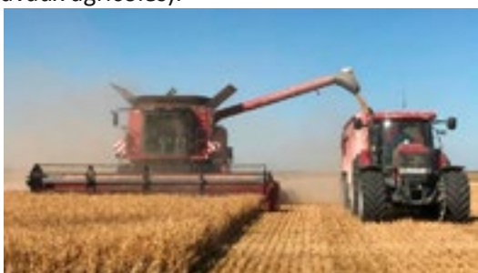
Vidange des grains dans la remorque lors de la moisson de céréales.

Les moissonneuses batteuses appartiennent à des CUMA (coopérative agricole qui met en commun du matériel agricole entre plusieurs agriculteurs adhérents) ou ETA (entreprise de travaux agricoles).