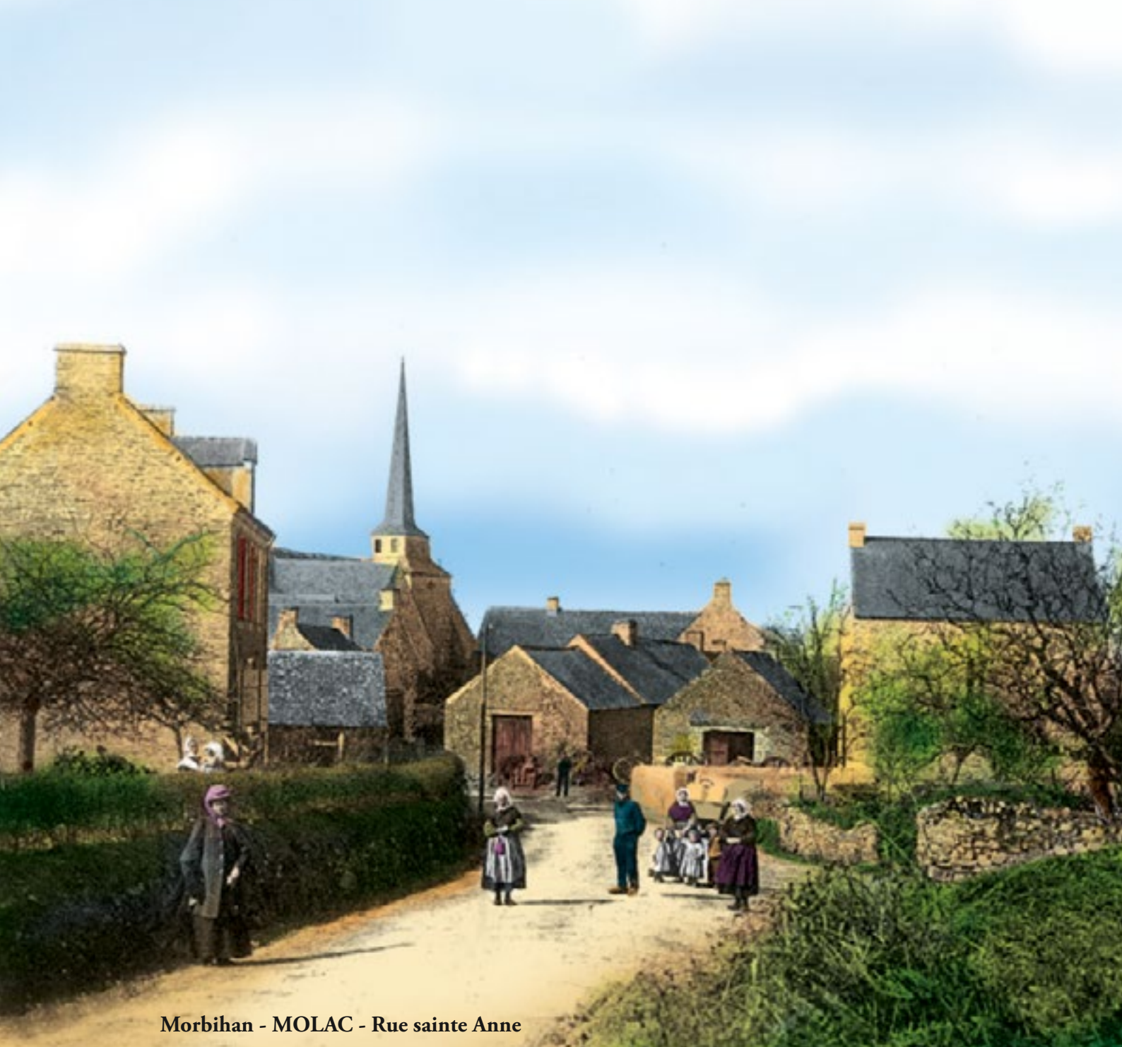
Morbihan - MOLAC - Rue sainte Anne