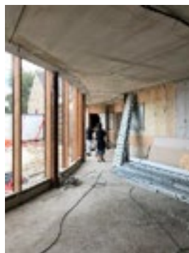
Le hall d'entrée

Mme Le Maire nous a proposé une visite guidée de la nouvelle école. Les travaux avancent bien, nous avons hâte d'être dans cette école aux locaux spacieux et fonctionnels. Nous y serons courant de l'année prochaine.