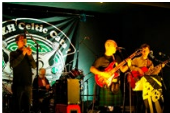
BOGZH CELTIC CATS

Concert ST Patrick du 29 février dernier à la salle polyvalente.