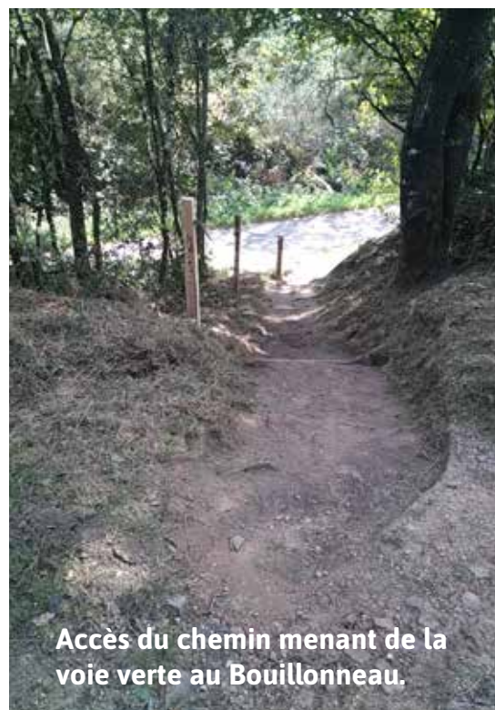
Accès du chemin menant de la voie verte au Bouillonneau.