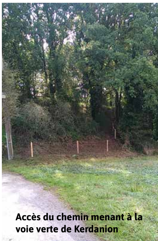
Accès du chemin menant à la voie verte de Kerdanion