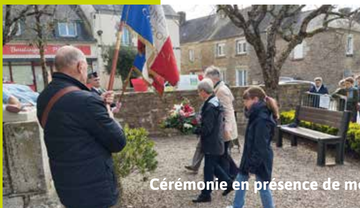
Cérémonie en présence de membres du Conseil municipal des enfants.